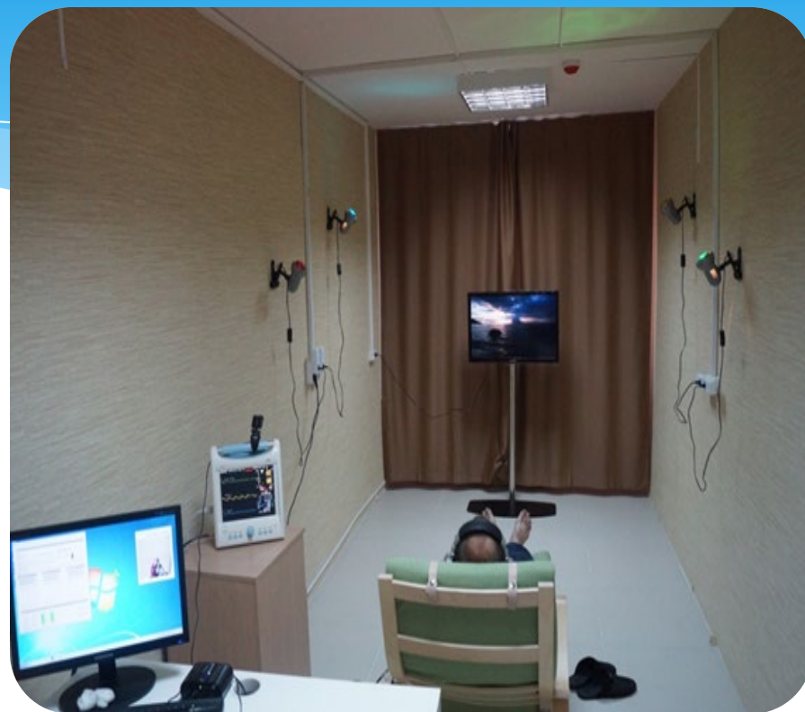
Аппаратно-программный комплекс для коррекции психосоматического состояния человека