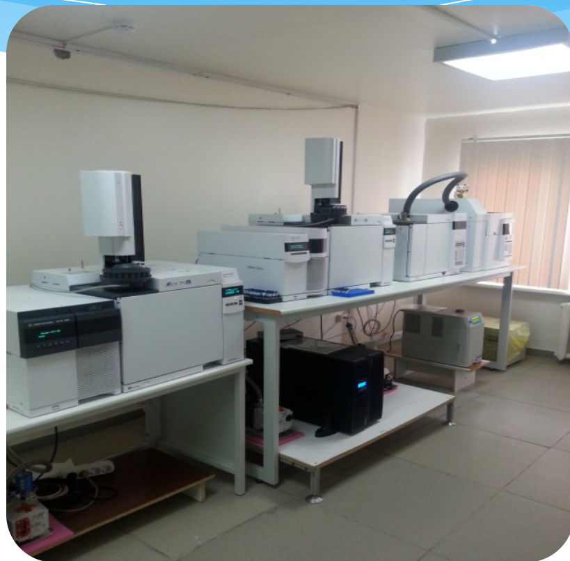
Метод основан на комбинации двух самостоятельных методов – хроматографии и масс-спектрометрии